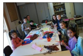
Bricolage de saison

Théâtre ados 11-15 ans : mercredi de 14h00 à 15h00