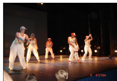
HIP HOP adultes

Salsa à partir de 13 ans : Samedi de 11h à 12h Nouveauté !!!