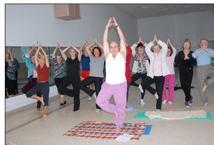
Yoga du mercredi matin