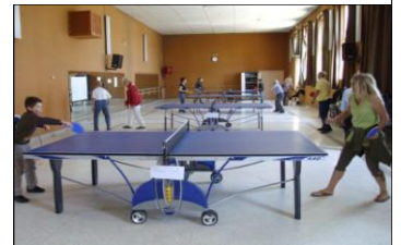
Tournoi ping pong 2010

Randonnée : mardi toute la journée, Rencontre avec l'équipe le samedi matin de 10h à 11h