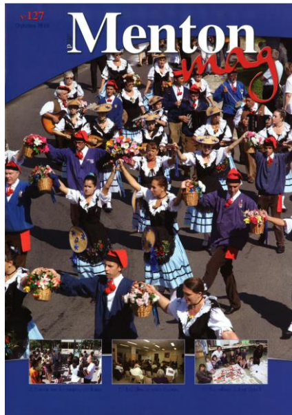
Menton Mag n°127 d'octobre 2014

Le bulletin municipal est dénommé « Pour Menton Mag ». Diffusé à 26.000 exemplaires, il a permis de relayer (distribution dans les boîtes à lettres, mise à disposition dans les lieux publics) les grandes étapes du projet : réunions publiques, exposition, délibérations, ... « Pour Menton Mag » est également disponible en permanence et en intégralité sur le site internet de la commune